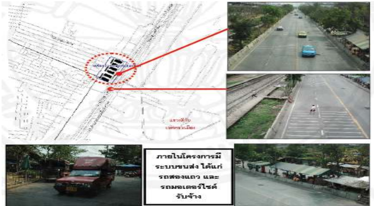
ภาพที่ 2.2 แสดงสภาพการจราจรบริเวณหน้าโครงการเคหะชุมชนทุ่งสองห้อง

แหล่งที่มา: พสิษฐ์ นิติวรคุณาพันธ์, 2551: 76.